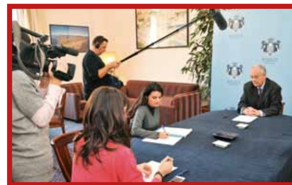
Le Ministre d'État en interview avec le JDA

C'est un travail qui s'inscrit dans une démarche globale d'amélioration de notre service public et