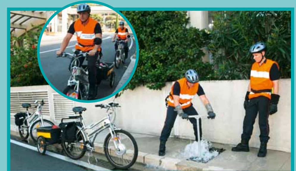
Les Sapeurs-Pompiers en tournée de vérification

Chaque année, le Corps des Sapeurs-Pompiers procède à la vérification de 329 bouches d'incendie sur la Principauté, à raison de trois vérifications par an.