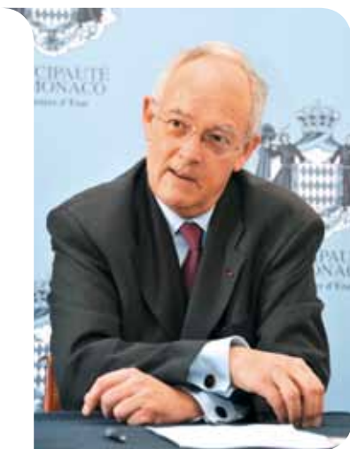
S.E. M. Michel Roger

Pour faciliter l'installation des entreprises en Principauté, la Direction de l'Expansion Économique a également rationalisé ses procédures et réduit ses délais d'instruction.