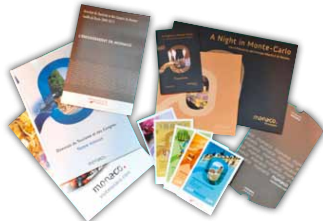
Sélection de brochures réalisées par la Section Edition et Documentation