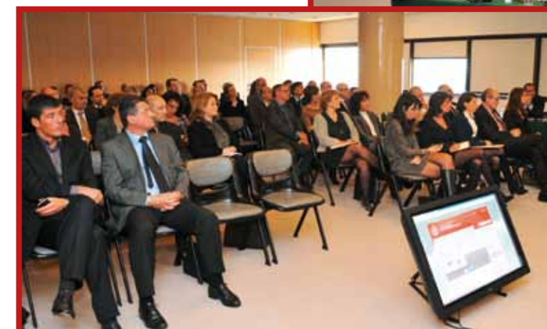
24 janvier 2012, le Ministre d'État présente les nouveaux outils de communication aux chefs de service

« La mobilisation de l'ensemble des Fonctionnaires et Agents est essentielle »