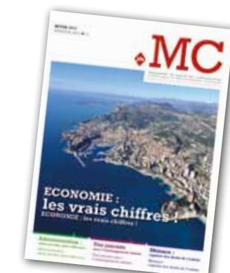
Maquette provisoire de la couverture du nouveau magazine « .MC »